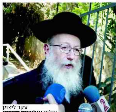
עקב ליצמן

כל אחד מוזמן לקרוא בספרות ולגלות שהנזקים הללו הם בלתי הפיכים. לא אמרנו שיהפוך לצמח, וגם היום יש בעיות שהן אולי לא בשוטף ביומיום, אבל הן קיימות. הקלות הבלתי נסבלת של הלעג ולפרש דברים שלא מכירים לפעמים גורמת לי לשאול את עצמי מה זו עיתונות?"