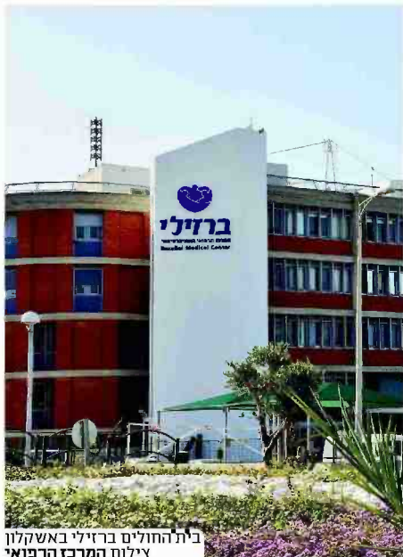
בית החולים ברזילי באשדוד צילום המרכז הרפואי