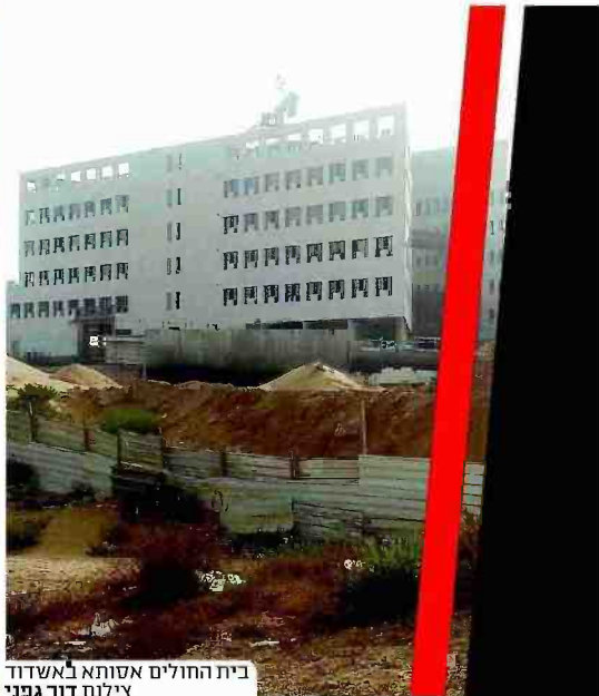
בית החולים אשדוד באשדוד