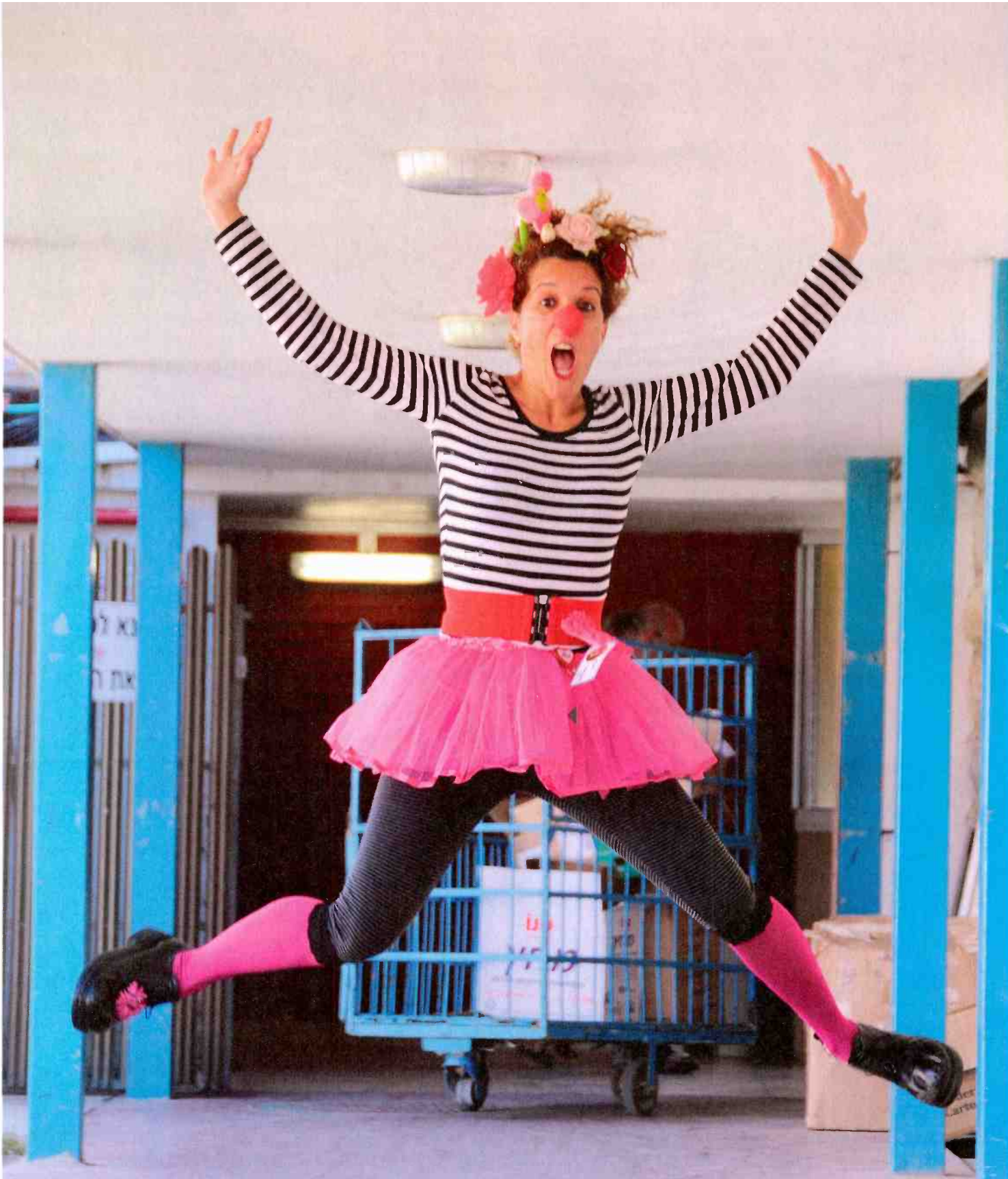
ליצנית כל השנה. חופש