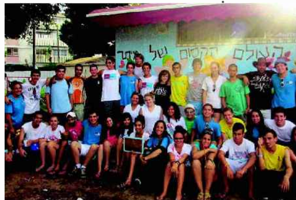
חברי המשלחת מאשקלון ומבולטימור ממשיכים את המסורת

חברי השליחות התנדבו ב"גשר" - מרכז לנוער אתיופי. הם צבעו וסיירו את החדרים במרכז ויצרו ציור קיר גדול. במרכז הקליטה ברנע הם הפעילו את הילדים ושיחקו איתם. בני הנוער ביקרו גם בבית החולים ברזילי, במחלקת ילדים ובמחלקה הג