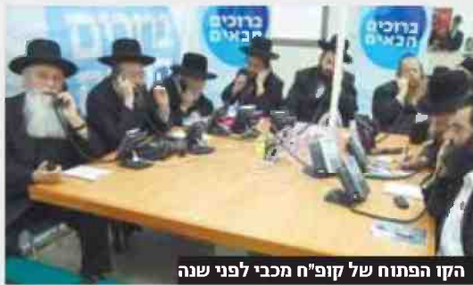
הקו הפתוח של קופ"ח מכבי לפני שנה