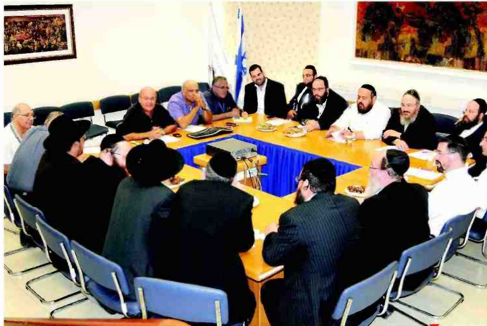
הוכרז על הקמת פורום הידבחת קבוע. מפגש עסקני הרפואה בבית החולים 'ברזיל' באשקלון

בסיום המפגש יצאו המשתתפים לסיור בין מחלקות בית החולים ועמדו על מערך הרפואה המקצועי הקיים בבית הרפואה. הנוכחים יצאו מהמפגש בתחושה כי הנהלת בית החולים מעוניינת להאזין וליישם את משאלותיו של הציבור החרדי ולעמוד על צרכיו הרפואיים וההלכתיים.