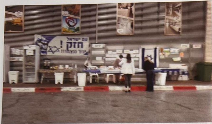
עמדת מזון ושתיה במלרד על ידי מתנדבים