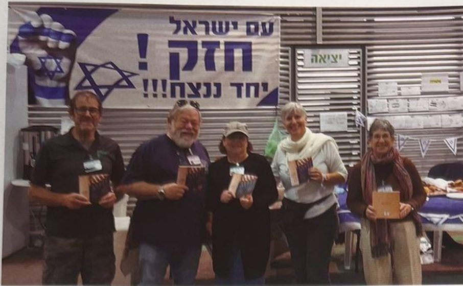
מתנדבים בחלוקת מזון ושתייה ברחבת המיזן- החל מ- זבאוקטובר