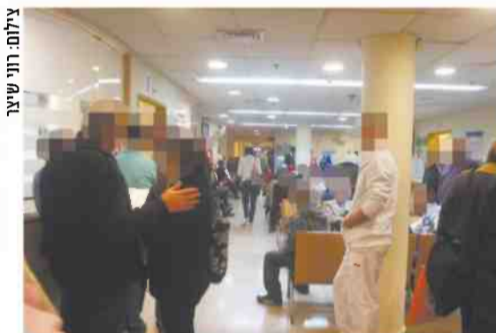
עומס במיון ביה"ח שיבא בתל השומר, אתמול

למותה. ההערכה היא כי האישה נפטרה משפעת החזירים או משפעת קשה. דיווח על המקרה נמסר למשרד הבריאות. מבית החולים נמסר עוד כי האישה הגיעה במצב קשה מאוד, וכי מצבה הידרדר במהירות עד לקריסת מערכות כללית. על אף ניסיונות ההחייאה הרבים שברצו בה, היא מתה.