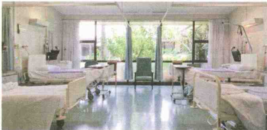
במסדרונות בתי החולים הציבו מיטות לאישפוז חולים, עקב הצפיפות המרובה בחדרים