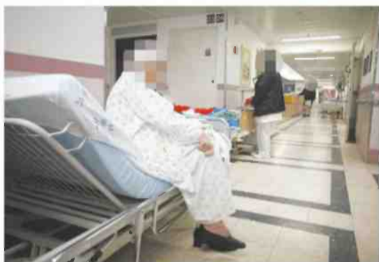
ביה"ח ברזילי, אתמול

ברוב בתי החולים פנו לציבור: אל תגיעו למיון אם לא מדובר במקרה דחוף • אחות ברזילי: "עברנו את הקיבולת" • חשש בסורוקה: בת 28 מתה משפעת