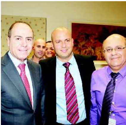
השר שלום ב'ברזיל'

בביקור שערך שר האנרגיה ופיתוח הנגב והגליל, סילבן שלום, במרכז הרפואי 'ברזילי' הודיע על סיוע ממשלי לרכישת ציוד טכנולוגי מתקדם לתועלת החולים.