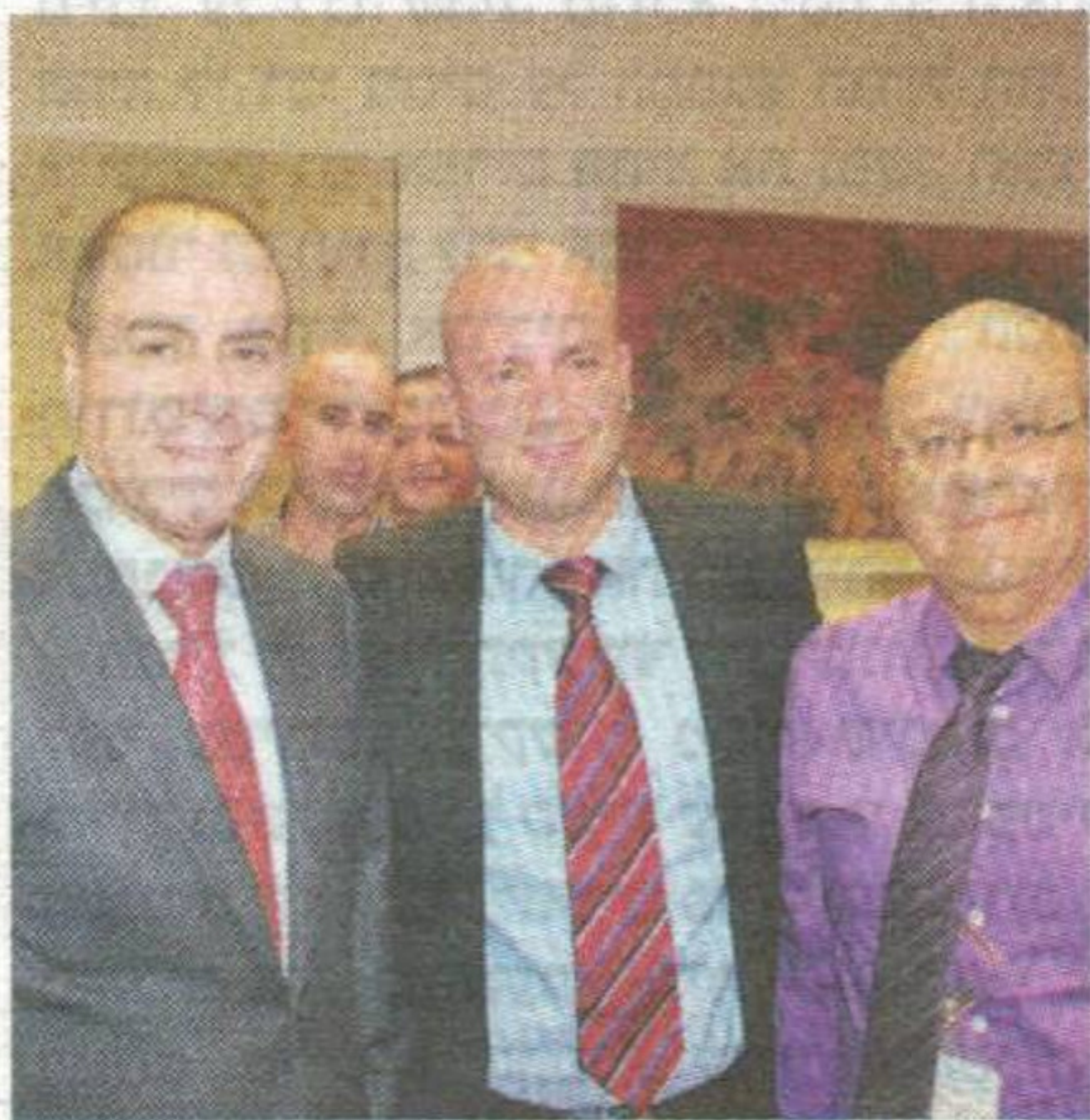
השר שלום ב'ברזילי'

בביקור שערך שר האנרגיה ופיתוח הנגב והגליל, סילבן שלום, במרכז הרפואי 'ברזילי' הודיע על סיוע ממשלי לרכישת ציוד טכנולוגי מתקדם לתועלת החולים.