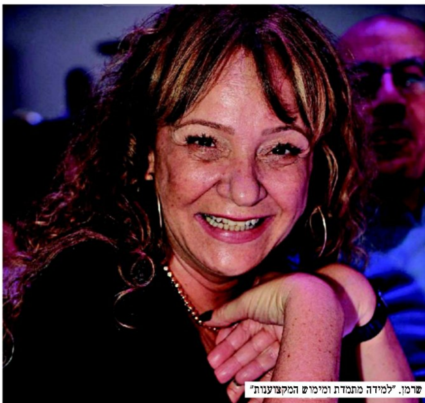
שרמן. "למידה מתמדת ומימוש המקצוענות"

חדשות. אנחנו נמצאים כעת לקראת התחדשות מטאורית, אנחנו בפני פתיחה של חדר מיון חדש ועשרה חדרי ניתוח חדשים ובפני מעבד מחלקת ילדים חדשה. בנוסף בפני מעבד ובפני מחלקת שיקום חדשה שלא נמצא באזור ובית החולים ברזילי מתחדש באופן יוצא דופן. השנה הזאת יש 4 אחיות חדשות וזה מעיד על זרימה חדשה וצעירה."