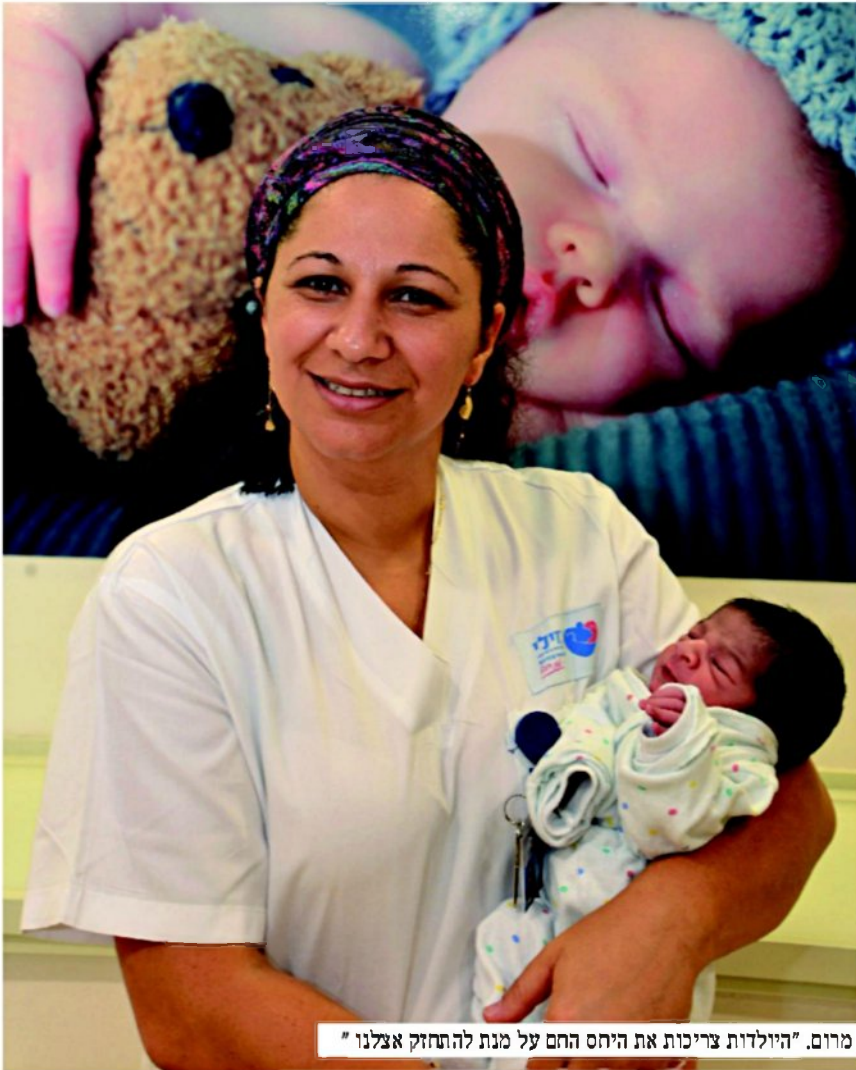
מרום. "היולדות צריכות את היחס החם על מנת להתחזק אצלנו"

האלו. כל אחות מקבלת מספר חודרים שהיא אחראית והיא מחויבת לזהות את זה ולדווח על ההרגשה שלה. לבחון קשר של אם – יונק. אמא שיש לה רתיעה שהיא לא ניגשת לתינוק, שהיא מתרחקת מהילד אנחנו מזהים את הדיכאון שמתחולל בה לאחר הלידה וצריך לראות איך עוזרים לה במצב הזה. המערך הוא תמיכה, יש לנו כאן בבית החולים כל מה שצריך על מנת לעזור לה, יש גם שירות פסיכולוגי שעוזר למחלקה."