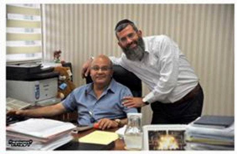
עוסק המדיע דרר מיי לוי והתא נאבי לרר