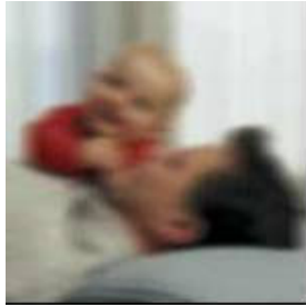
ראיה עם קטרקט