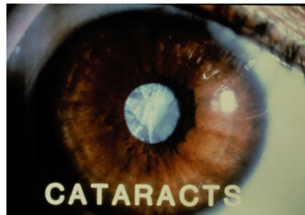
עין עם קטרקט מתקדם