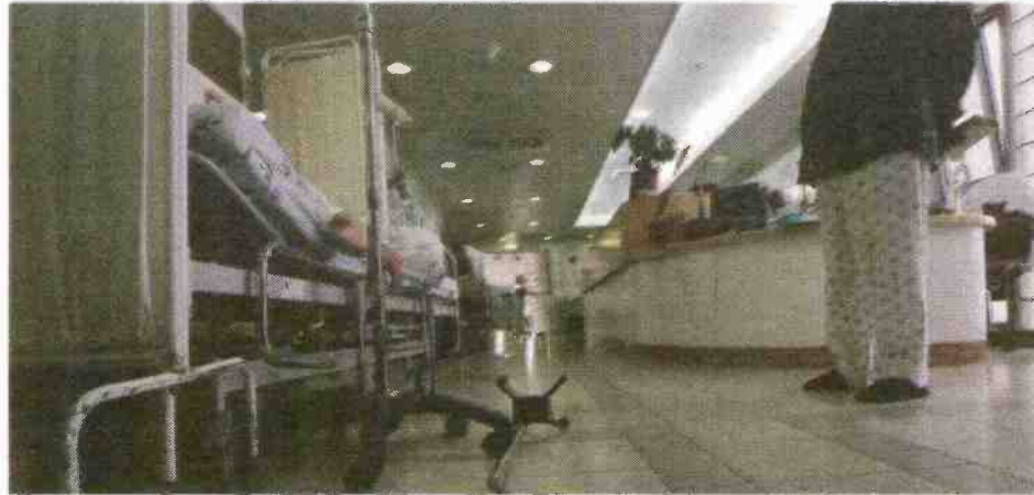
גם מסדרונות בתי החולים בתפוסה מלאה

בעקבות הקושי של בתי החולים לקלוט את כל החולים, ממשיכים כמד"א לתגבר משמרות כאמבולנסים ובאנשי צוות נוספים. נראה שהמצב לא עומד להסתיים בקרוב. מגפת השפעת בעיצומה ובבתי החולים מעריכים שהעומסים רק ילכו ויגדלו בימים הקרובים.