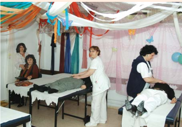
רפואה אלטרנטיבית ביום האחות