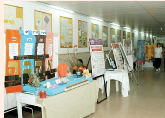
פוסטרים שהוכנו במיוחד ליום האחות

למרות הקיצוץ במשאבים הצוות הסיעודי תרם להעלאת התפוקות וההכנסות בשנה שחלפה. והחשוב מכל, הצוות שילב מקצועיות ואנושיות ובזה גדולתו.