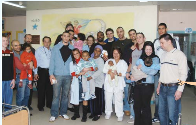
כוכבי הכדורסל, אליצור אשקלון חוגגים במחלקת ילדים