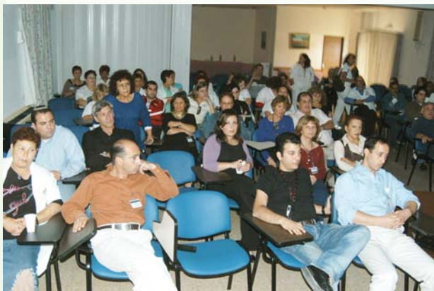
קהל בהצגה “לי זה לא יקרה”

ההצגה הנה צעד משלים ליום עיון למנהלים שדן בסוגיות שונות באחריות מנהלים בתאונות עבודה. ביום העיון נכחו כ-80 מנהלים מן הסקטורים השונים.