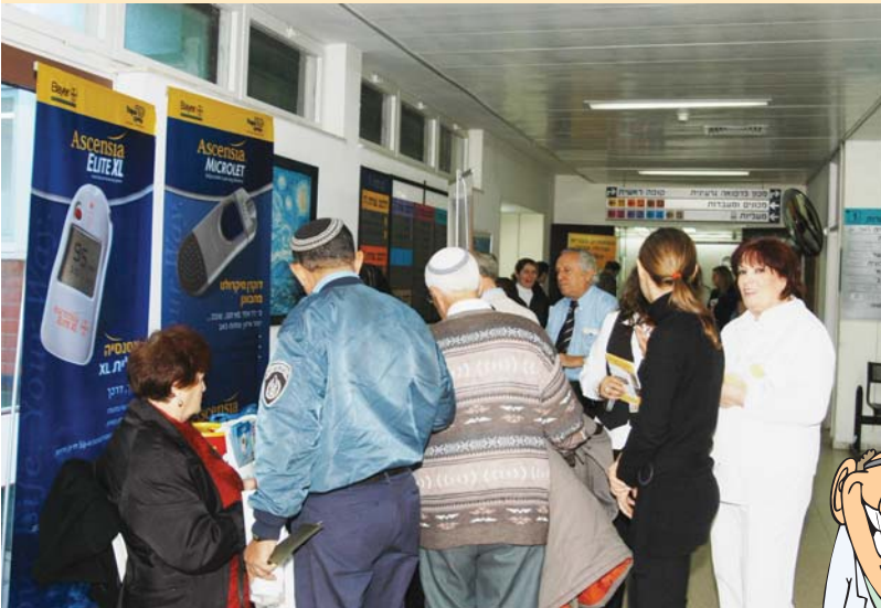
ציבור המבקרים בתערוכה ביום הסוכרת