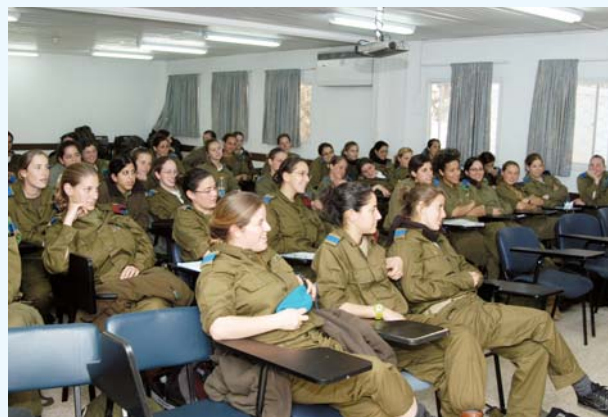
צוערות ביום התנדבות

במהלך חג החנוכה הגיעו קבוצות רבות ומגוונות לשמח את המאושפזים במחלקות ביה"ח. סופגניות, לביבות, ומתנות חולקו ע"י מאות מבקרים ביניהם חיילי צה"ל.