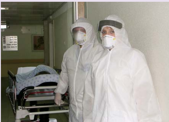
בגדי המגן מפני השפעת

בתאריך 16/5 התקבלה הודעה על כך שישנם לולים עם תמותת תרנגולי הודו בשני ישובים במחוז דרום - חבל אשכול. צוות לשכת הבריאות של מחוז דרום יצא מייד לשטח לבצע איתור מגעים ולתת טיפול מונע. בהמשך לכך, גם במחוז שלנו, מחוז אשקלון, התגלתה המחלה - למחרת, ב-17/5, קיבלנו הודעה בשעות הבוקר על כך שלול במושב שדה משה חשוד כנגוע במחלה. יש במקום כבר יומיים תמותה של העופות, אשר התקדמה במהירות עצומה. יש לציין שבעופות זו התמונה הקלינית העיקרית - מחלה קשה ביותר שמתקדמת במהירות גדולה וגורמת למות העוף. צוות לשכתנו יצא למושב, איתר את כל האנשים שעבדו בלול הנגוע ונתן להם טיפול מונע - עוד באותו היום במהלך ערב-לילה. מדובר בחקלאי בעל הלול והפועלים שלו. הטיפול המונע כלל מתן תרופת תמיפלו, אשר מעכבת את נגיף השפעת. למחרת, במהלך השבת, החלו גם פעולות של השירותים הוטרינריים במשרד החקלאות, במטרה להפסיק את האפשרות של התפשטות המחלה בלולים אחרים באזור. נכון להיום, 22.3.2006, כבר למעשה הושלמה המתה של כל הלולים במושב שדה משה וברדיוס 3 ק"מ. לשכת הבריאות מנטרת את מצב הבריאות של כל העובדים שמשתתפים במבצע הסילוק של הלולים ומספקת מתן טיפול מונע לפני חשיפה במידת הצורך. יש להדגיש, שמהירות ויעילות בפעילות צוותי הלשכה התאפשרו רק בגלל העבודה המהירה והמקצועית של האחיות, אשר מורגלות להיענות לאירועים חריגים בכל שעות היממה בכל יום בשנה. מערך זה של תגובה אפידמיולוגית מיידית נמצא היום בסכנה קשה לאור הכוונות של צמצום השרות לבריאות הציבור.