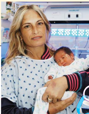
צילום היולדת עם בנה

בראייה של מניעה כדאי לחשוב על הרחבת השירות לאוכלוסיות נוספות במסגרת ייעוץ טרום הריוני כגון, תלמידי תיכון יא-יב, סטודנטים ואחרים.