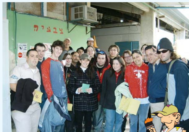
משלחת מבוולטימור בעבודת צבעות בבית החולים