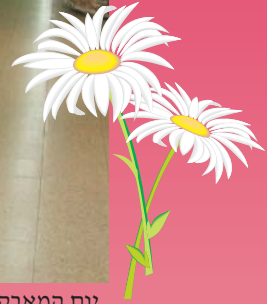
יום המאבק נגד אלימות

של העוברים ושבים (נשים וגברים) אשר שאלו שאלות, לקחו חומר ופליירים ותמכו. לסיכום, תופעת האלימות נגד נשים אינה גזירת גורל וניתן לטפל ולמנוע.