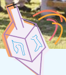
ביקור חיילי צה"ל בחנוכה

במהלך חג החנוכה הגיעו קבוצות רבות ומגוונות לשמח את המאושפזים במחלקות ביה"ח. סופגניות, לביבות, ומתנות חולקו ע"י מאות מבקרים ביניהם חיילי צה"ל.