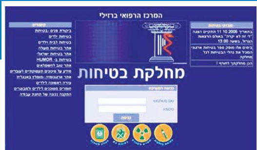
הדף הראשי של האתר לבטיחות

פינת בטיחות זו בעיתון ברזילי מהווה במה לחשיפת פעילויות רבות הנעשות בתחום הבטיחות במרכז הרפואי ברזילי.