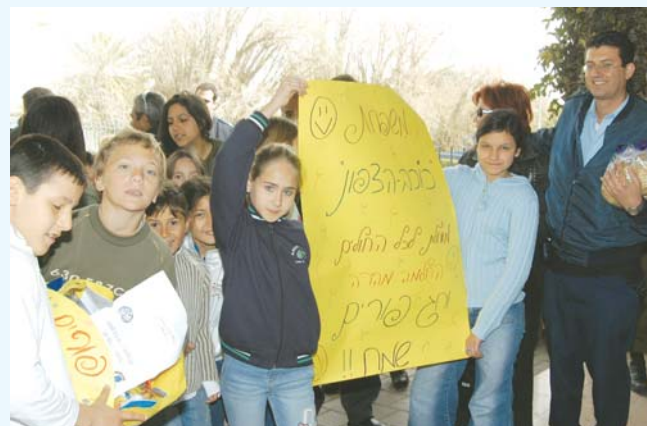
ביקור ילדי כוכב הצפון בבית החולים