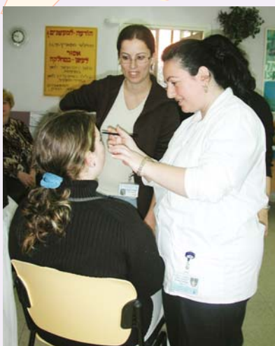
יום טיפוח במחלקה הפסיכיאטרית

"שקר החן והבל היופי" הגם שלא בתרבות הזוהר עסקין - לטיפוח אישי ולשפירה על היגיינה יש השלכות רבות וחשובות על תחומים שונים ביניהם העלאת תחושת הערך העצמי, השתלבות בחיי החברה, שיפור הדימוי האישי ושפירה על הבריאות.